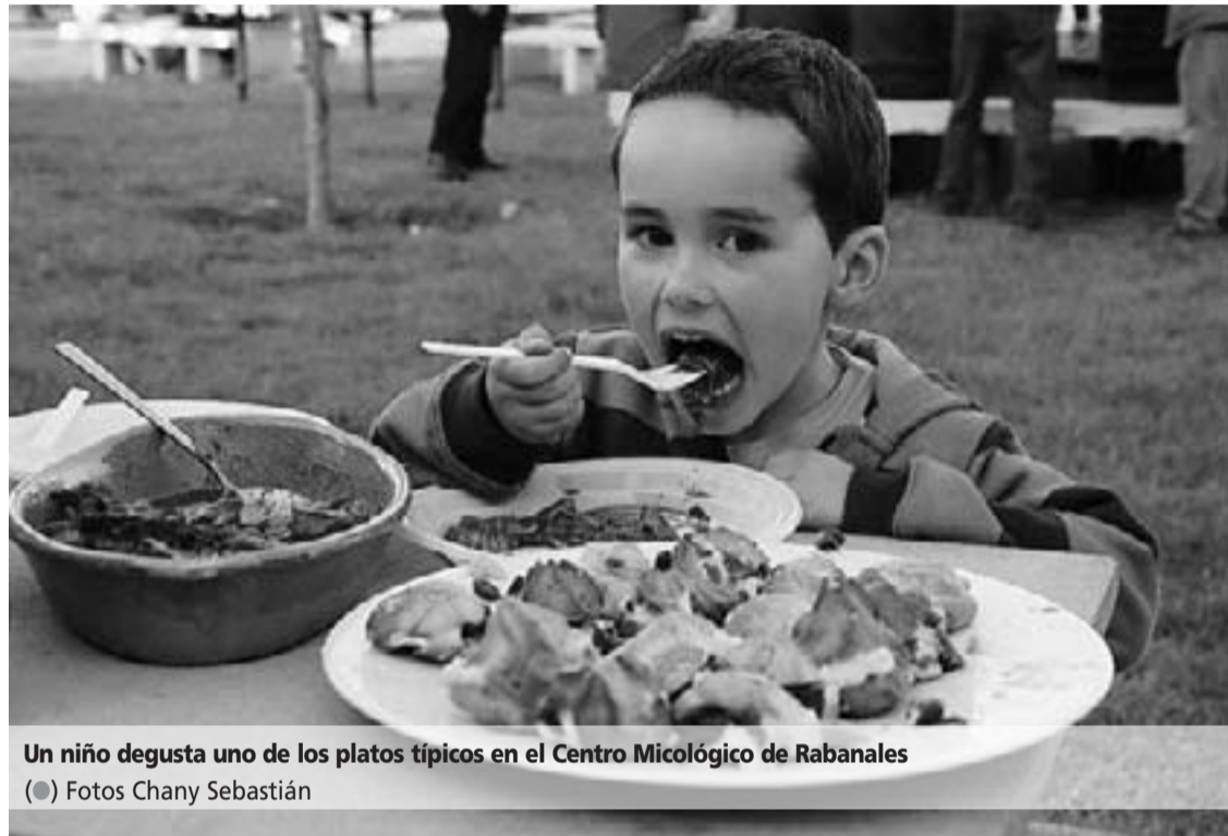
Un niño degusta uno de los platos típicos en el Centro Micológico de Rabanales (●) Fotos Chany Sebastián

Los quesos es un sector que tiene a los «Beato de Tábara» de San Martín en su único exponente, una delicia, elaborada con leche de cabra de la explotación propia, de la familia